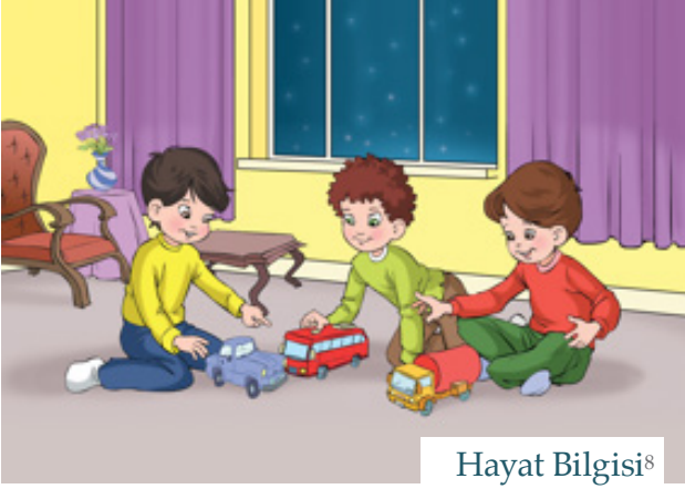
Hayat Bilgisi 8