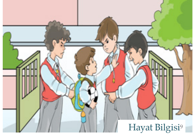
Hayat Bilgisi 9